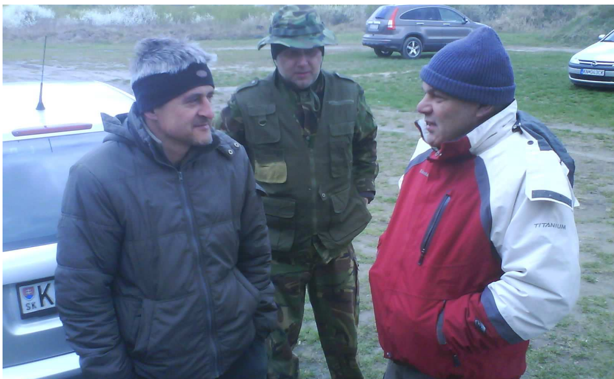
Pocit chladu – ruky vo vreckách a zima v tvárach strelcov. Tak takto sa súťažilo 8. apríla 2012.