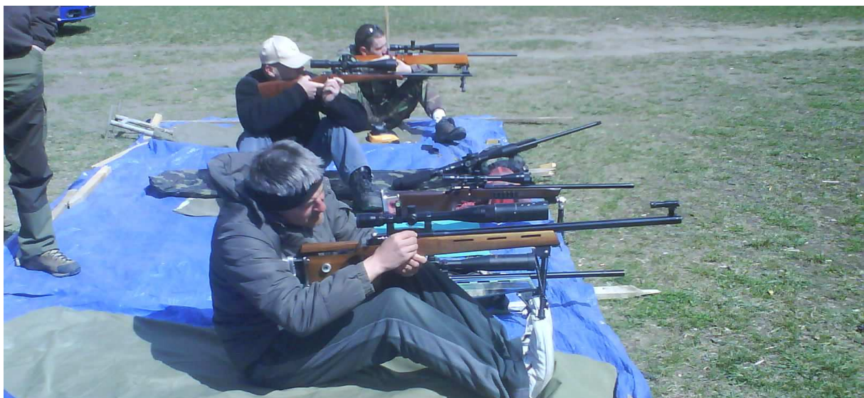
Rôzne štýly strelby v sede. Opora na nohách bola povolená, aj keď netradičná....