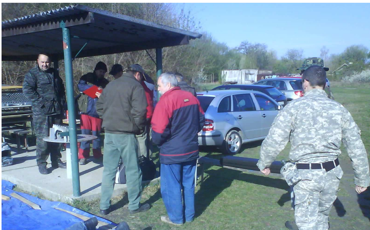
Šum pred súťažou. Modrá plachta – príprava na možný dážď. Nakoniec nepršalo.