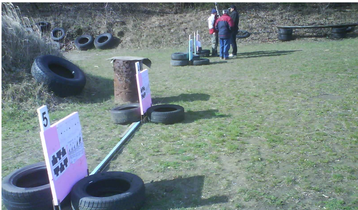
Náladovky bez komentára. Terče museli byť podporené gumami kvôli vetru.