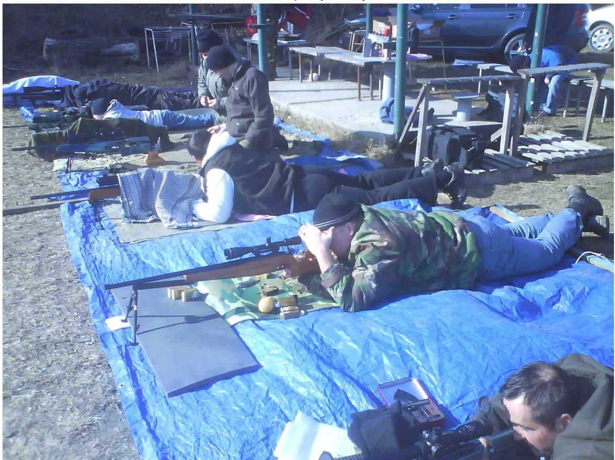
Aj slnko potrápilo strelcov...