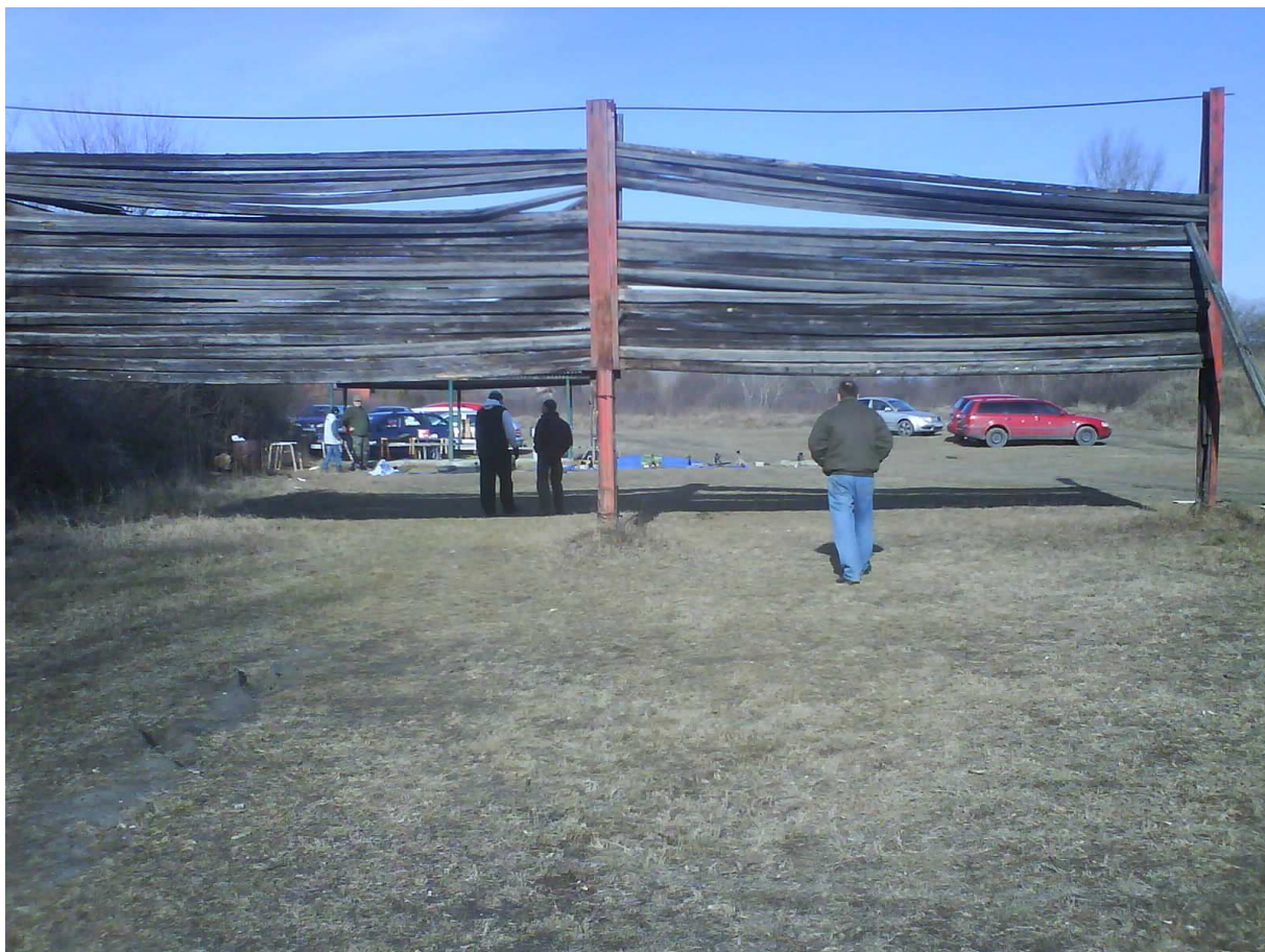
Pohľad od terčov.