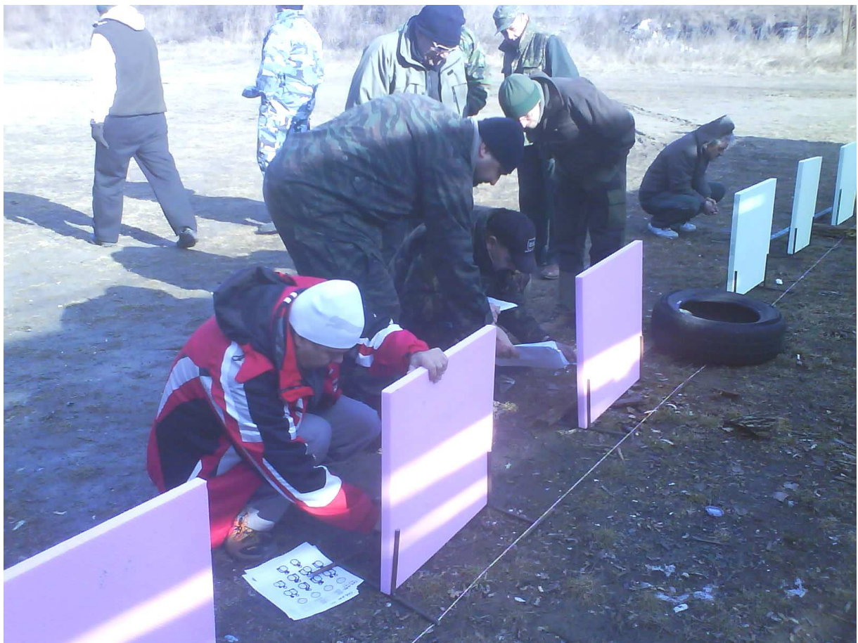
Roman pripievňuje nové terče.