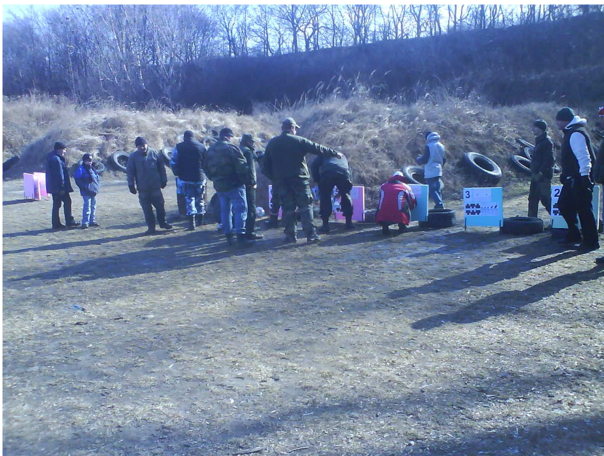
Zhluk pri terčoch na 75m. Všimnite si ohnuté steblá trávy na valoch.