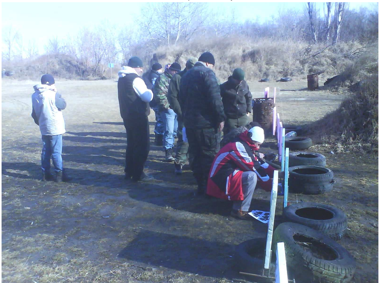
A zase 75m trčová čiara. Poistenie pneumatikami je potrebné.