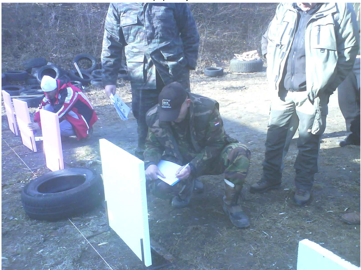
A opäť hodnotenie bodov. Všimnite si polystyrénové dosky na terče.