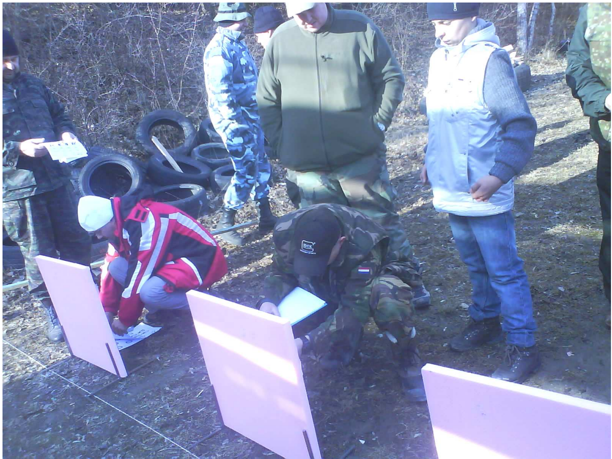
Padli prvé výstrely...