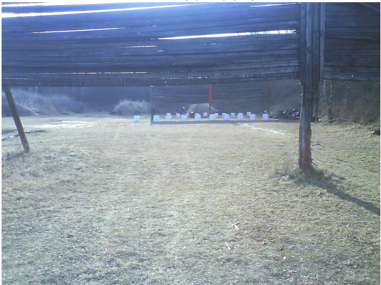
Terče sú rozložené v predu 50m a v zadu 75m.